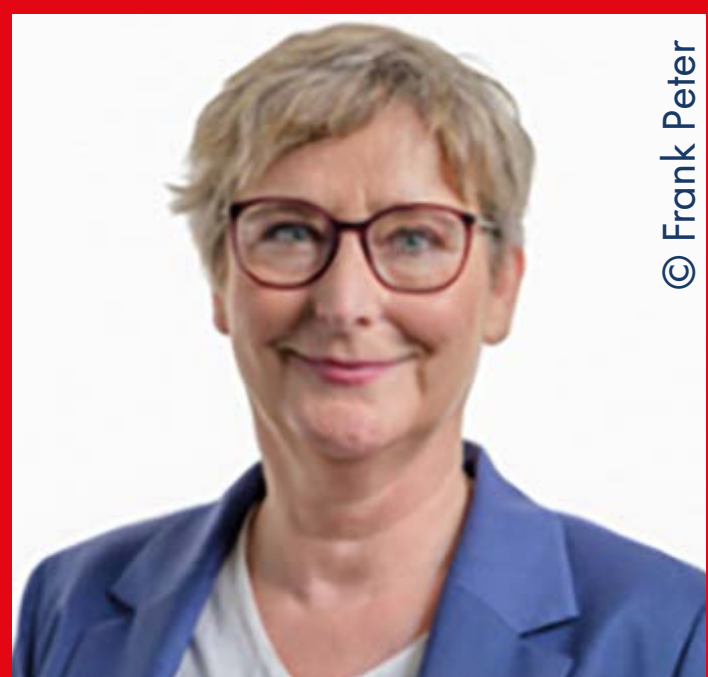
Katja Günther | GRÜNE Staatssekretärin im Ministerium für Energiewende, Klimaschutz, Umwelt und Natur des Landes Schleswig-Holstein